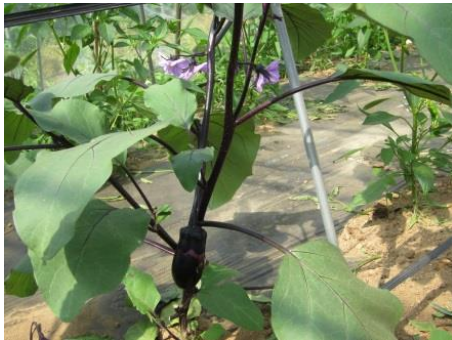
搾り粕堆肥のなす