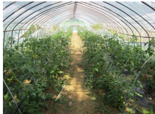
ひまわり堆肥野菜栽培

前号ではまだ何も生えていませんでしたが、なす！ミニトマト！なっていますね！！ひまわりの搾り粕を利用した肥料を使った野菜が、通常の野菜とどのように違って来るか楽しみです！