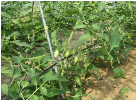
搾り粕堆肥のミニトマト(アイコ)

続 ハウス写真送ります。生育は至極順調旺盛です。ミニトマト(アイコ)・パプリカ・シシトウ・なす着果、トマト開花中。高宮農園野菜出荷中です。更に今年は直売所も開設しました。